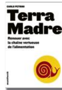
TERRA MADRE de CARLO PETRINI éditions Alternatives, 294 pp., 18 €.

Terra Madre est né en 2004 et, pourtant, cet extraordinaire projet de mondialisation positive, qui n'a cessé de se développer, reste méconnu en France. Le livre de Carlo Petrini – journaliste et sociologue, fondateur du mouvement Slow Food et seul Italien à figurer au palmarès du Guardian des « cinquante personnes qui pourraient sauver le monde » – donne les clés de cette alternative au système agro-industriel. Créé pour lutter contre la malbouffe, Slow Food, qui compte 100 000 membres, en est venu à la promotion des produits «bons et sains» et donc à la défense d'une agriculture vivrière, respectueuse de la biodiversité. Etre gastronome, pour Slow Food, c'est ne pas ignorer les liens qu'il y a entre l'assiette et la planète.