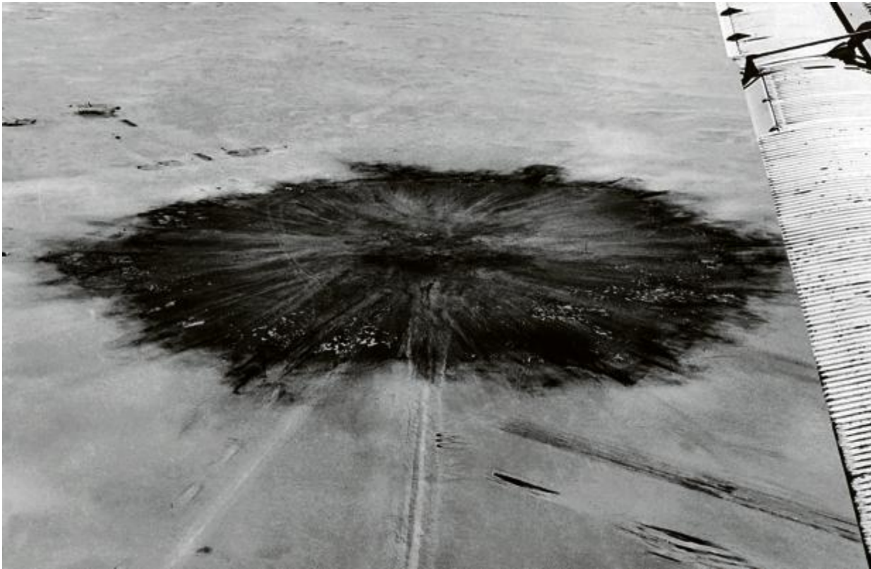
Le 20 février 1960, lors du premier essai nucléaire français à Tanezrouft, dans le Sahara algérien.